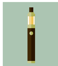
Produits de vapotage