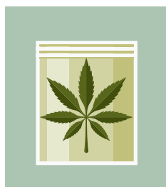
Fleurs et feuilles de chanvre

Tous les produits contenant plus de 0,3% de THC sont considérés comme des stupéfiants et à ce titre interdits.