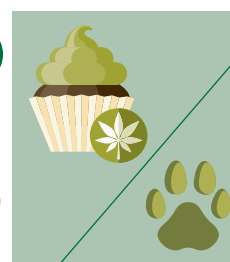
Produits alimentaires et vétérinaires